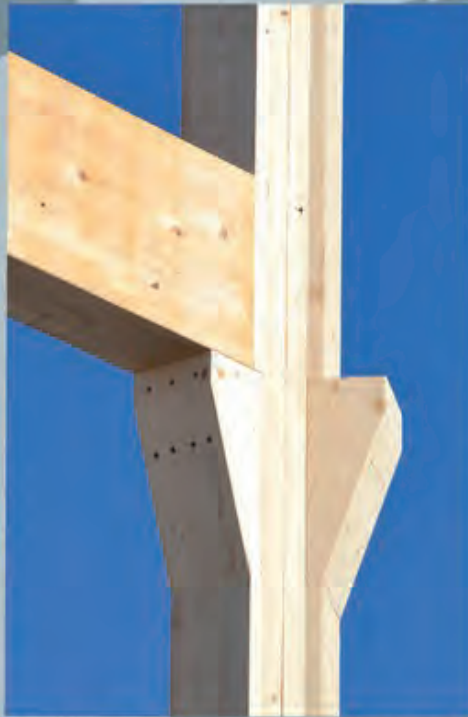
Traditionelle Holzknagge neu gebaut