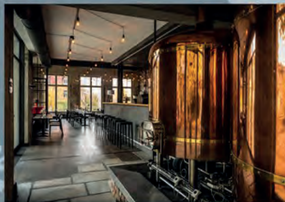
Schankhalle Pfefferberg