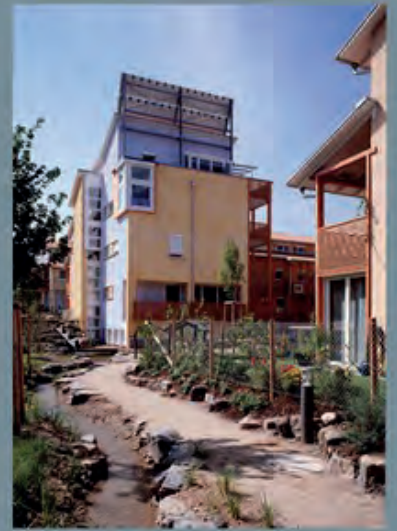
Baugemeinschaft Ökohaus Berlin, © Beate Lendt Arkadiensiedlung, Asperg | Eble Messerschmidt Partner © Gragnato