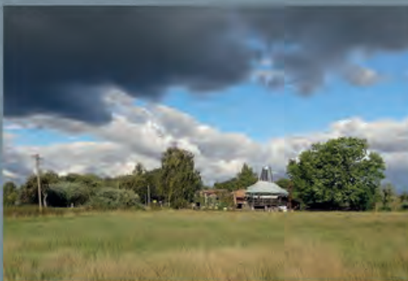
Organische Architektur | Theater am Rand © G. Ludewig