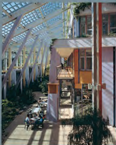
Wohn- & Gewerbehof Prisma Nürnbg. E. Messerschmidt Partner

Die Mitglieder des B.A.U. blicken auf Jahrzehnte lange praktische Erfahrung in ökologischen Bauweisen zurück, von der die Jüngeren profitieren. So finden Bauherrschaften, HandwerkerInnen, WissenschaftlerInnen, Studierende und interessierte KollegInnen die richtigen AnsprechpartnerInnen und ExpertenInnen für ihre spezifischen Fragen zum ökologischen Bauen in Theorie und Praxis.