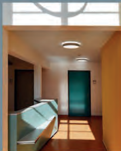
Atmosphäre durch Oberflächen & Farbe Ina Sanden, © P. Kuebart