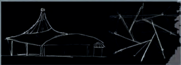
Self-supporting structures