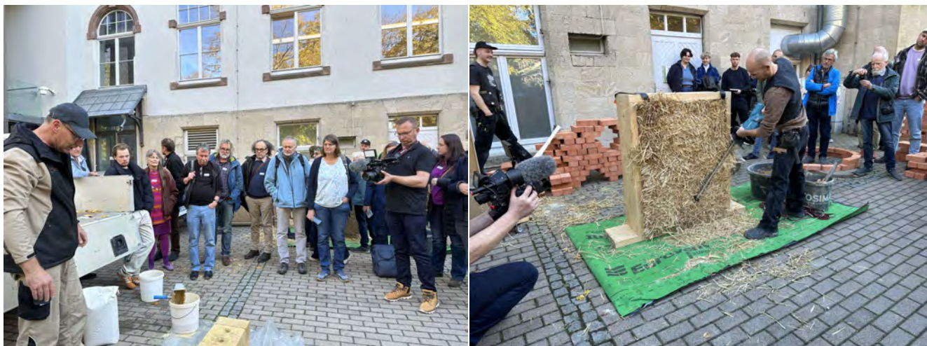
B.A.U. in Erfurt Oktober 2024

Die diesjährige Mitgliederzahl setzt sich zusammen aus 50 stimmberechtigten Personen und 4 Ehrenmitgliedern.